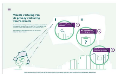
2015 - Privacy statement Facebook The Hague Innovators Prize